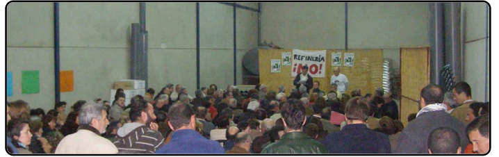
Entre los objetivos principales de la PCRN se encuentra el de informar a los ciudadanos sobre sus actividades. Para ello, celebran mensualmente una Asamblea de libre participación. Como en otras ocasiones, se llevó a cabo en una nave ante la imposibilidad de celebrarla en un local público más acorde. www.plataformarefineriano.es