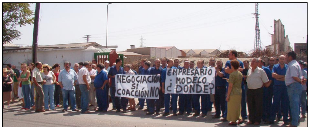
Concentración de protesta de los antiguos trabajadores de Transidesa.

Mientras tanto la situación de los trabajadores fue de mal en peor. Primero estuvieron jellos mismos! tirando la fundición. Cuando ya no hubo más cosas que destruir se les «invitó» a trasladar su puesto de trabajo a Jerez, a lo que la mayoría se negaron. Después de la firma del acuerdo 26 de septiembre de 2006, hubo una regularización de empleo y prácticamente todos empezaron a cobrar la prestación por desempleo. Evidentemente, algunos de ellos tenían derecho al máximo legal de desempleo (dos años) pero otros han tenido que buscarse la vida después de agotar su derecho a paro. El resto (prácticamente la mitad) han acabado tirando la toalla reciente-