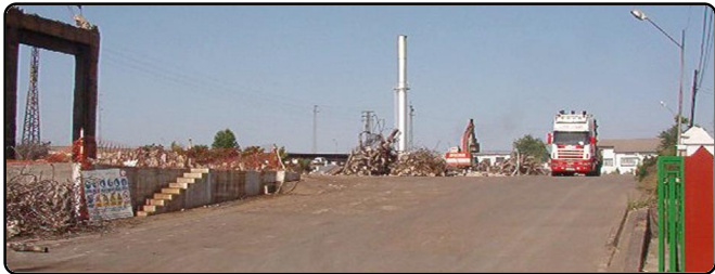
Proceso de derrumbe de la antigua fundición.