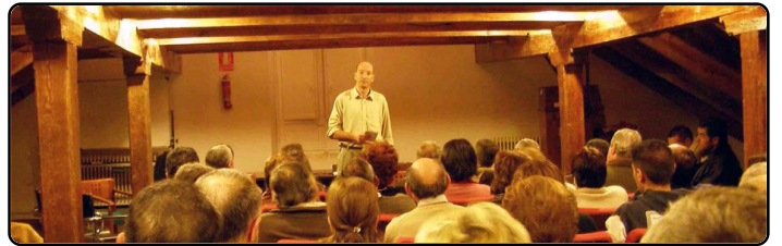
CV continúa escuchando la voz de sus ciudadanos, sus propuestas y sus inquietudes. Mensualmente se reúnen en Asamblea, elevando los acuerdos a sus tres concejales para su debate en los Plenos Municipales.