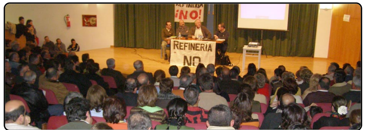
Jesús Garzón, quien fuera Director General de Medio Ambiente de la Junta de Extremadura y creador del Parque Nacional de Monfragüe, estuvo en Fuente del Maestre, el 18 de enero, en una charla coloquio organizada por la PCRN. «La refinería es un proyecto propio del siglo XIX, no del XXI».